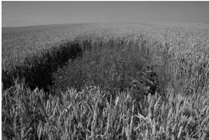
Abb. 2 Ein sogenanntes Feldlerchenfenster im Winterweizen: Kleinflächen von 3 m x 6 m, die statt mit Weizen mit einer Wildblumenmischung angesät wurden.

Unsere Erfahrung zeigt, dass viele Landwirte wenig auf allgemeine Überlegungen, wie sie in einem Punktesystem zu Grunde liegen, reagieren. Hingegen sprechen sie sehr positiv auf konkrete Maßnahmen zu Gunsten einer attraktiven (Tier-)Art an. Ein eindrückliches Beispiel dafür ist das Feldlerchenprojekt der IP-SUISSE und der Schweizerischen Vogelwarte: Rund ein Viertel aller IP-SUISSE Getreidebauern legen freiwillig und ohne Entschädigung so genannte Feldlerchenfenster an (Abb. 2) oder praktizieren Weitsaat, bei der auf 5 % des Getreidefeldes jeweils zwei von fünf Saatscharen geschlossen bleiben (Jenny 2004).