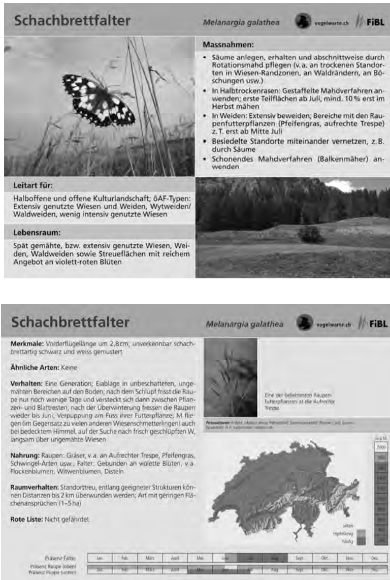
Abb. 3 Beispiel einer Leitartenkarte (Graustufenversion der Vorder- und Rückseite; Original farbig)

Für 2009 ist geplant, die Bewirtschafter von 30 Landwirtschaftsbetrieben mit Hilfe dieser Leitartenkarten zu beraten. Dabei werden pro Betrieb etwa ein halbes Duzend Leitarten eingesetzt. Bei dieser Beratung geht es um den gesamten Betrieb, nicht nur um einzelne ökologische Ausgleichsflächen. Gleichzeitig wird auch eine betriebswirtschaftliche Analyse mit Hilfe des Programms BETVOR durchgeführt. Ziel ist, dass jeder Betrieb eine merklich erhöhte Punktezahl erreicht.